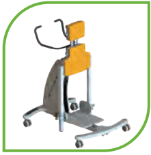
Alapváz (Kék, rózsaszín, piros, zöld és sárga színekben érhető el)