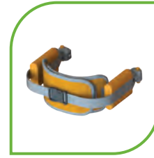
Hátrahajtható laterális rögzítőpárna hevederrel