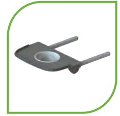
Terápiás asztal tálkával